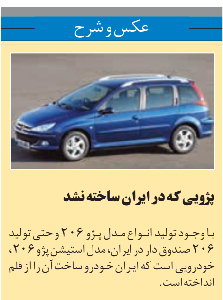
عکس و شرح