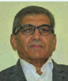
همه فانی اند و او باقیست