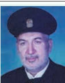
بدین وسیله در گذشت مرحوم مغفور بزرگ خاندان

خانواده های کامکاری – زرافشان – میرزایی جراحانجیان و فامیل وابسته