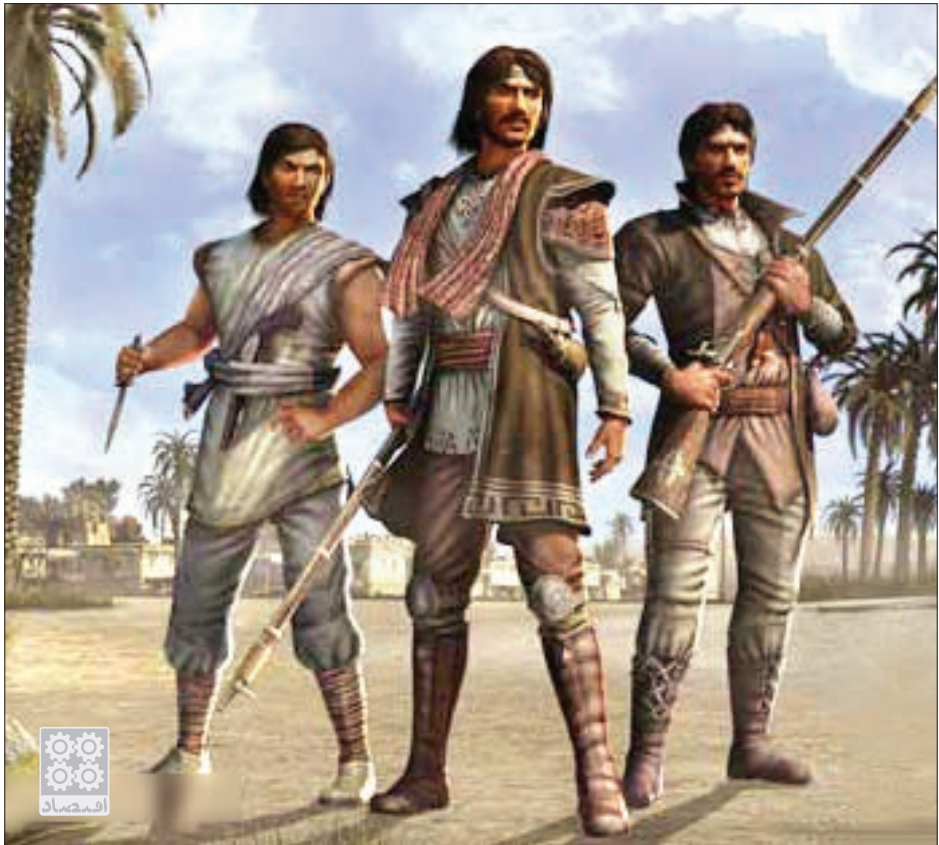
نمایی از بازی ایرانی میرجهنا

کانون حضور ایرانی ها در بازار بازی جهانی نیز از نظر تعداد ایرانی که تاکنون محصولات خود را در بازار جهانی کرده اند، بیش از ۱/۲ میلیون دلار درآمد از خارج کشور کسب کنند. چند روز دیگر - ۱۰ آبان - نمایشگاه تجاری گیم کانکشن فرانسه آغاز به کار خواهد کرد و شما می توانید پیگیر اخبار ۱۲ شرکت ایرانی باشید که در دوره نوجوانی، با اعتماد به نفس بالا محصولات خود را در قلب اروپا عرضه می کنند. حتماً حالا به این فکر می کنید که برای ورود به این صنعت جذاب، آینده دار و پرسود چه باید کرد؟