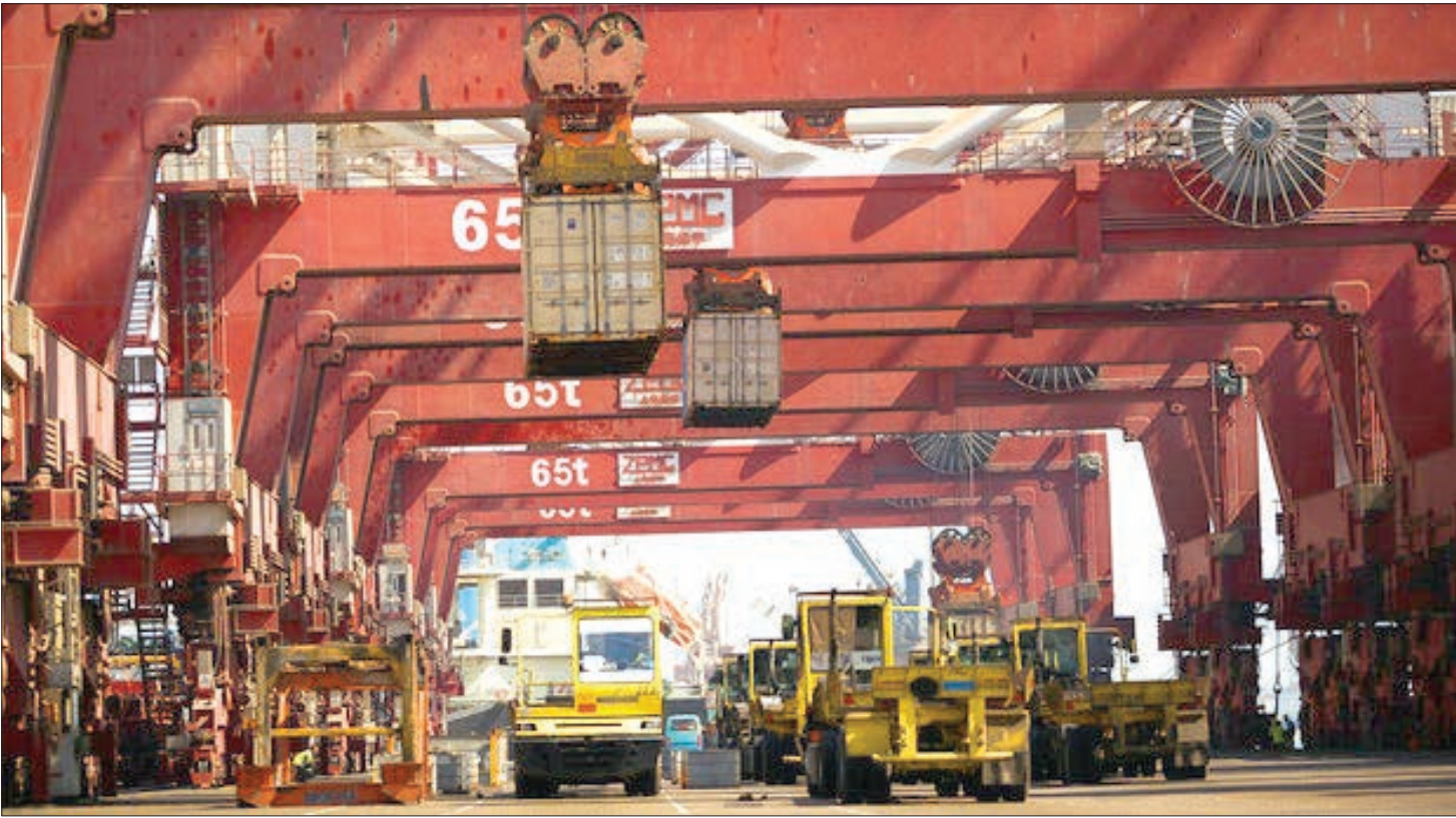
ناظر گمرکات هرمزگان

فعلان ترانزیت در خراسان رضوی: قوانین گمرکی، ارزیابی های سلیقه ای، کمبود تجهیزات در گمرک شهیدرجایی و موازی کاری سازمان هازمان ترانزیت را طولانی کرده است