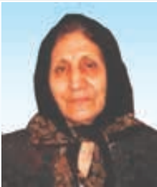
هرگز نکتم مهر و وفای تو فراموش