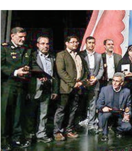
عکس از جشنواره

در آیین اختتامیه هفدهمین دوره انتخاب بهترین کتاب دفاع مقدس، برگزیدگان هر بخش مشخص شدند و جوایز خود را دریافت کردند. اسامی برگزیدگان به شرح زیر است: گروه آثار مرجع و کلیات تقدیر ویژه «رهنمای شهدای دزفول» به قلم منوچهر محمدی‌پور تقدیر ویژه: «سپاه در گذر انقلاب»؛ نویسنده: محمد کاظم فروغی جهری گروه داستان بزرگ سال تقدیر ویژه: «نگهبان تاریکی»؛ نویسنده: مجید قیصری گروه بین‌الملل تقدیر ویژه: «پژوهشنامه ادبیات انقلاب اسلامی و دفاع مقدس»؛ نویسنده: غلامرضا کافی گروه پژوهش نظامی سیاسی تقدیر ویژه: «دیپلماسی ایران و قطعه‌نامه ۵۹۸»؛ نویسنده: ایرج همتی و داوود صباپی گروه تاریخ شفاهی تقدیر ویژه: «آقای دکتر با تاکید بر روایت راوی»؛ نویسنده: یوسف کشفی آزاد و مرتضی عسae تقدیر ویژه: «راه با تاکید بر روایت راوی»؛ نویسنده: محسن رضایی و حسین ارستانی