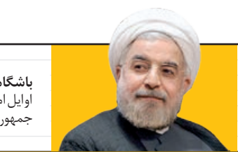
حسن روحانی، رئیس‌جمهور ایران

مایلکل پنس معاون رئیس‌جمهور آمریکا هفته گذشته