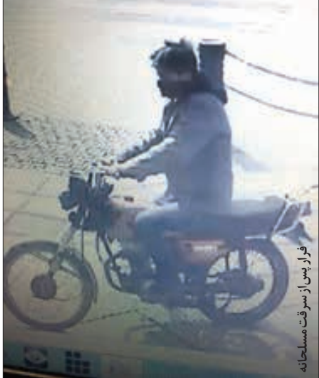
سارق مسلح هنگام ارتکاب جرم در بانک