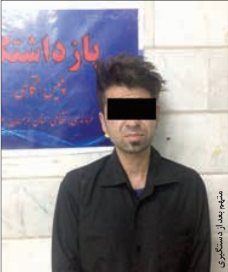
متهم بعد از دستگیری