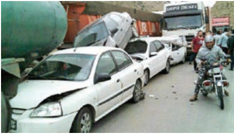
تصادف نجیره‌ای در محور فیروز کوه -امیرآباد (روز گذشته)