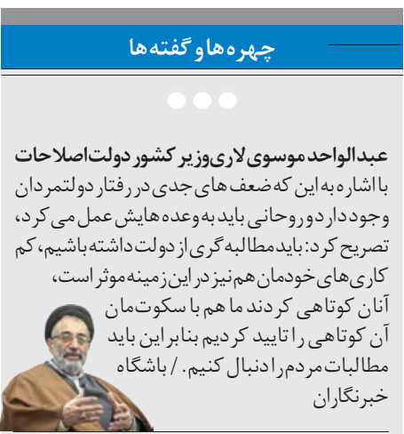
چهره ها و گفته ها

بر اساس ابلاغیه جدید یک مقام مسئول اجرایی به تعدادی از ادارات و سازمان های دولتی، اعلام شده باتوجه به آغاز مرحله دوم ورود اطلاعات و تسکلیات و ساختار دستگاه های اجرایی در سامانه ملی طراحى شده به این منظور، مدیران مربوط باید علاوه بر ورود اسامی ویست سازمانی همه افراد شاغل در زیر مجموعه خود اعم از رسمی یا پیمانی، به بار سال فهرست کارمندان در حال مرخصی (اعم از استعلاجی، بدون حقوق یا تحصیلی، در حال ماموریت خارج از کشور، تعلیقی و حتی ترک خدمت و دارای غیبت در پست سازمانی واحد مبدأ اقدام کنند.