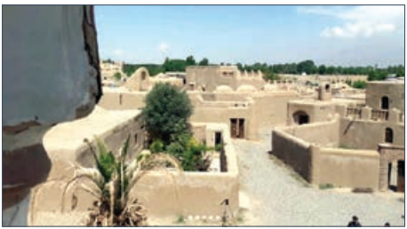
سر نوشت د کور های سریال «مختار نامه»