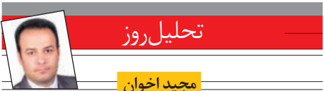
خبر نگار صدا و سیما در تکیه

زبان درازی آنکلام مر صد کرا اعظم آلمان در حاشیه بار دیدوی از یک مدرسه در سه‌ربروت سوزه‌ر سانه‌ها شد ووطن‌های زیادی را به دنبال داشت. بسیاری از کوه‌کا کنی که در این مدرسه درس می‌خوانند، پنهان‌شدن اسوری هستند که همه را با خانواده‌هایشان به لبنان مهاجرت کرده‌اند. آنکلام مر کل و امانوئل مارکون، خواستار تالش کشورهای دیگر اروپایی برای پذیرش تعداد بیشتری پناهنچو هستند تا فشار از روی آلمان، ایتالیا، یونان، بر داشته‌شود و پناهنچویان به صورت منصفانه‌تری در خاک اروپا تقسیم شوند.