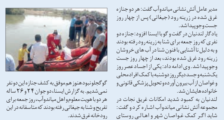
مدیرعامل آتش نشانی میاندآب گفت: هر دو جنازه غرق شده در زربینه رود (جغاتی) پس از چهار روز جست وجو پیدا شد.

یادگار لندنیان در گفت و گو با ایسنا افزود: جنازه دو نفری که روز جمعه برای شناسایی به زربینه رود رفته بودند و به دلیل ناآشنایی بافتون شنا در آب های خروشان زربنه رود غرق شده بودند، بعد از چهار روز جست وجو پیدا شد. وی ادامه داد: یکی از اجساد عمر روز یک‌شنبه و جسد دیگر روز دوشنبه با کمک افراد محلی و غواصان از آب بیرون آورده و تحویل پزشکی قانونی و خانواده هایشان شد.