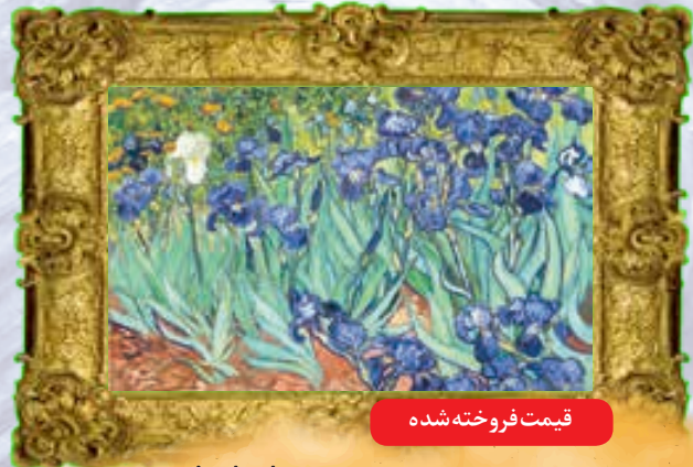
قیمت فروخته شده

ونگوگ که علاقه خاصی به شب داشته، شمع‌ی را روی کلاه حصیری اش می‌چسباند است، تا نور کافی برای نقاشی کردن فراهم کند