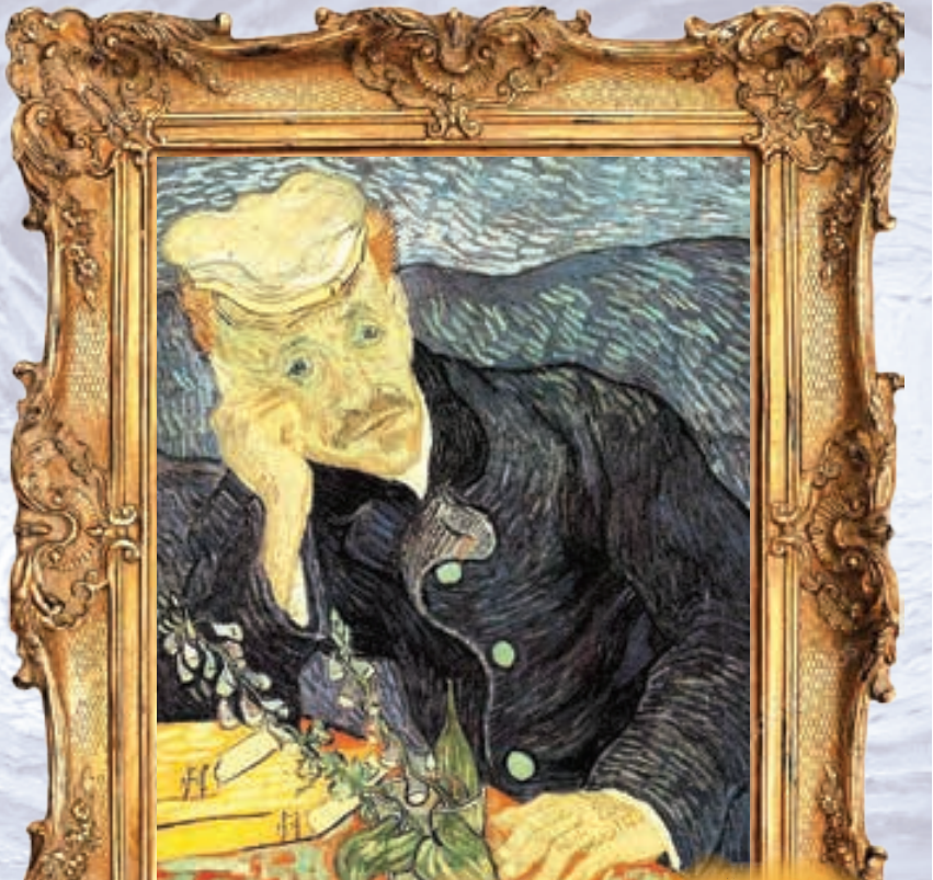
قیمت فروخته شده

بزرگداشت «محمدنوری»؛ چهره‌ماندگار موسیقی کشور در خانه‌شاعران ایران برگزار می‌شود. به‌گزارش روابط‌عمومی خانه‌شاعران ایران، هم‌زمان با هشتمین سالروز درگذشت «محمدنوری»، دوشنبه، هشتم مردادماه‌ساعت ۱۸ مراسم‌گرمایی‌داشتنی‌برای‌این‌خواننده‌وموسیقی‌دان بزرگ کشور در محل خانه‌شاعران برگزار می‌شود. در این‌ویژه‌برنامه،‌شاگردان «محمدنوری» واهالی‌شعر و موسیقی حضور خواهند‌داشت.