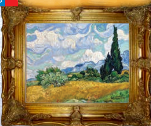
قیمت فروخته شده

(( کاهش ۲۰ درصدی مصرف برق کولرهای گازی با تنظیم درجه حرارت بر روی ۲۵ درجه ))