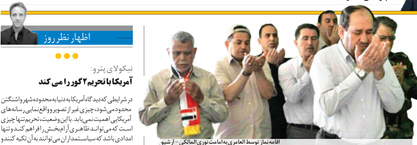
اقامه نماز توسط العامری به امانت نوری المالکی