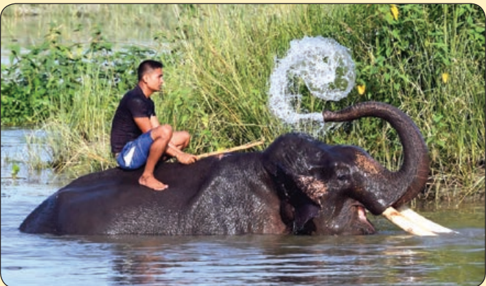
یاهو! فیلیپینی که فیلش را در رودخانه می‌شوید، هندوستان

خواهی که برنجیزدت از دیده‌رودخون گر جلوه می‌نمایی و گر طلعه می‌زنی