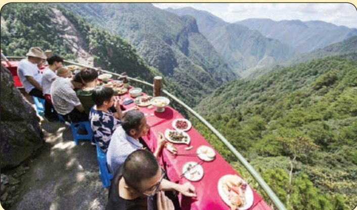
حضور گردشگران در رستورانی که بر لبه پر تگاه کوهستان ساخته شده، چین

* یاشکر از کارکنان خوب‌تون به ویژه همکاران زندگی سلام، به خواهشی ازتون دارم اونم این