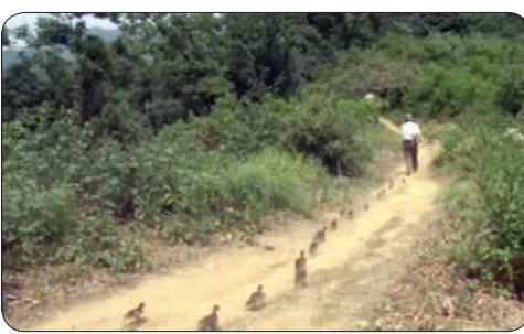
آرژانتی - سنترال - مرد

* تازه گیتا تلویزیون یاد گرفته برای این که ذهن مردم رو آماده کنه میگه فلان چیز که قرار بود گرون بشه ولی نشد، بعد میری تو بازار می‌بینی شد! * گوجه جوری گرون شده که وقتی میری کبابی طرف می‌پرسه کنار گوجه‌تون کباب هم بزنم یا نه؟! * یادش به خیر همیشه تو مدرسه فکر می‌کردم این پنکه سقفی اگر بيفته، کیا در جاسر شون قطع میشه! از بچگی به ذره خشن بودم، نه؟! * از آپشن‌های مدرسه ما هم این بود که روز اول مهر می‌پرسیدن رفیق صمیمی پار سالت کی بود؟ بعد که اسمش رومی گفتیم می‌انداختن مون توی دوتا کلاس جداگانه! * دوران راهنمایی وضعیت جوری بود که یک‌روز از به معلم کتک نمی‌خوردیم آخر وقت جلوی مدرسه همدیگه رو می‌زدیم که کسی شک نکنه! * معلم‌های شما هم می‌گفتن شما بدترین کلاسی هستین که تو این چند سال داشتم؟! * شما وقتی استاد میاد بریا نگو، ما به همه می‌گیم دبیرستان مبصر بودی! * بچه بودم باشگاه فوتبال ثبت نام کردم، مربی منو کشید کنار گفت الان فقط دو سمت زمین بازیکن می‌خوایم. بال‌چپ دوست داری یا بال‌راست؟ گفتم برام چپ و راستش مهم نیست، کلا بال و کتف دوست دارم، فقط کوبیده دوست ندارم. نمی‌دونم چرا از نگ‌زدن بابام اینا بیان دنبالم! * کاغذ دیواری اون قدر گرون شده که دیوارهای خونه ات رو بدی ته‌مینه میلانی نقاشی کنه ارزون‌تر در میاد! * ما زشت نیستیم، ما فقط نمی‌دونیم از چه زاویه‌ای و با چه فیلتری از خودمون عکس بگیریم! * اون موقع که هارداکسترنال ۳۰۰ تومن بود خریدم، الانم که یک و ۶۰۰ شده باز نمی‌خرم، موقعی هم که بشه ۲۰ تومن باز نمی‌خرم و این خرچه افسوس خوردن ادامه داره!