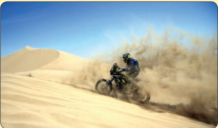
ای پی ای | رقابت موتورسواری داکار ۲۰۱۸، پرو

خانم و آقای فرگوسن که تازه از دواج کرده بودند، در خیابان در حال قدم‌زدن بودند که خانم برای این که خودش را برای همسرش لوس کند و میزان عشقش را بسنجد، از او پرسید: «عزیزم اگه من داخل جابه‌بیتیم، تو میای منو نجات بدی؟» آقای فرگوسن که سعی می‌کرد لیخندش را مخفی کند، با ذوق گفت: «اگه بگم آره، تو می‌بری؟!»