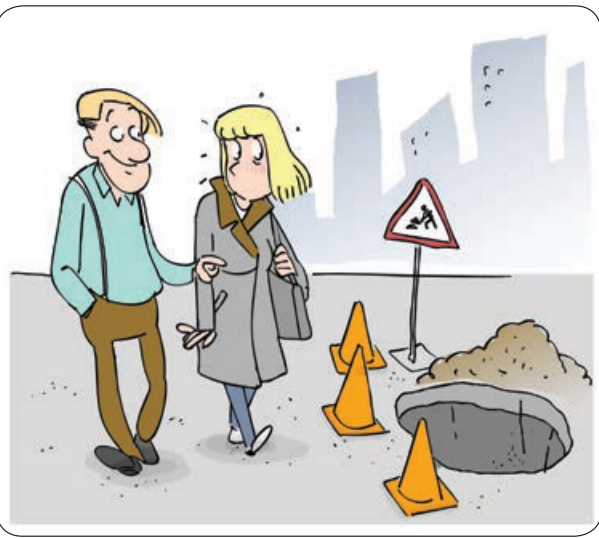
ترجمه و تصویرسازی: فرنگیس یاقوتی، سعید مرادی

برای نهادینه کردن قوانین و اهنمایی و اراندگی در ذهن دانش‌آموزان توصیه می‌کنیم بچه‌ها بروند مجموعه فیلم «سریع و خشن» را تماشا کنند تا از آن فیلم عبرت بگیرند. آن‌ها در طول قصه فیلم با اراندگی‌های عجیب و غریب آشنا خواهند شد و این کمک می‌کند ما فرداراننده‌هایی مسئولیت‌پذیر داشته باشیم، البته به این شکل که هر کار را توی فیلم انجام دادند بچه‌های ما خلافتش را انجام دهند. اما یکی از مراحل دیگر این توکل‌های باغ‌زدگی در آینده مر حله از دواج خواهد بود. به نظر من برای این مر حله هم دوستان باید فیلم مناسبی را برای درس‌گفتن انتخاب کنند. پیشنهاد ما فیلم «جدایی نادر از سیمین» است که دانش‌آموز می‌تواند به خوبی با مسئله جدایی آشنا شود. خوبی فیلم هم این است که توش باز است و معلم می‌تواند از بچه‌ها بخواهد به عنوان تکلیف شب خودشان پایان جدایی را ادامه دهند و دوباره نادر را به سیمین برسانند. اما در پایان از تلویزیون هم بگویم که یکی از انتقادات جدید مردم به تلویزیون در پخش فصل دوم سریال دلدادگی اتفاق افتاده است. این سریال ظاهرا یک جوری دار دپخش می‌شود که بینندگان برای تماشای آن باید ۲۴ ساعته در کانال‌های مختلف بگردند تا از پخش‌های خواهد مثلاً یک قسمت را امشب ساعت ۹ پخش می‌کنند و قسمت بعد را سه روز بعد ساعت ۱۱ شب می‌گذارند تا همه سورپرایز شوند. ما به مسئولان برنامه‌ریزی توصیه می‌کنیم همان طور که دارند ساعات پخش چندبار به مختار را برنامه‌ریزی می‌کنند یک ذره نظم در پخش باقی سریال‌ها هم داشته باشند مطمئن باشند ضرر نمی‌کنند.