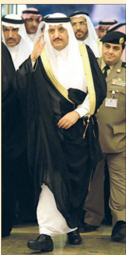
شاهزاده سعود بن محمد بن سلمان در مراسم رسمی.

روزانه ۱۰ میلیون بشکه نفت نقش مهمی در اقتصاد جهانی بازی می‌کند که بر هم خوردن توازن قدرت و هر گونه آشوب در این کشور تأثیری بسیار منفی بر اقتصاد جهانی دارد. او این مسئله خوشایند آمریکا و غرب نیست. از این رو، ماموریت اصلی شاهزاده احمد بن عبد‌العزيز فعلاً تثبیت قدرت خاندان حاکم از طریق ترمیم شکاف رخ‌داده در آن و جلوگیری از تکروری‌های محمد بن سلمان است که موجب نگرانی همپیمانان غربی عربستان شده است. اما اگر این ماموریت اثر دخالت‌های بن سلمان بی‌سرانجام بماند و این تکروری‌های در دسراسری متوقف نشود، بعید نیست آمریکا با اعمال نفوذ مانع پادشاهی وی شود و از حذف حمایت کند.