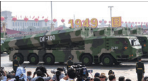
موشک میان برد DF-100 برای میاز به ناوهای جنگی

ماجرای زنی که در رویای رسیدن به شهرت، برادر رهبر کره شمالی را کشت