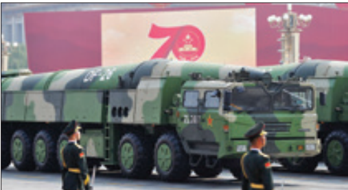
موشک اتمی میان برد DF-26 که بر دآن به پایگاه نظامی امریکا در گوام می‌رسد

با وجود دارا بودن میلیون‌ها نفر پیاده نظام، چین طی سال‌های گذشته تلاش کرده ضعف خود را در مجهز کردن و آموزش دیدن نیروی دریایی و هوایی بر طرف کند. حالا این کشور که به جای وارد کننده، صادر کننده تسلیحات سبک و سنگین شده است، سعی در تقویت نیروی دریایی خود دارد. در همین راستا، چین