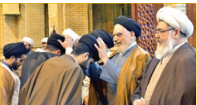
۲۰۰ طلبه حوزه علمیه خراسان به لباس روحانیت ملیس شدند