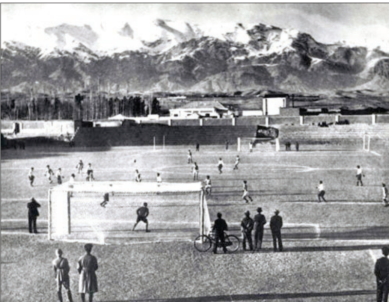
عکس تزیینی است - دور نمایی از ورزشگاه امجدیه (شهید شیرودی) در سال ۱۳۱۴

چگونه نخستین تیم مشهدی در سال ۱۲۹۸ خورشیدی، پشت باغ ملی شکل گرفت؟