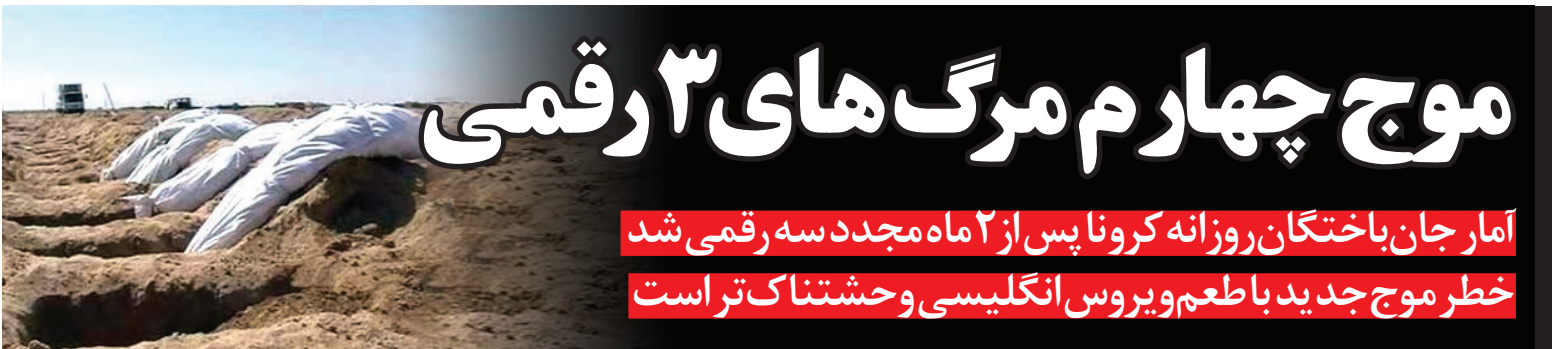
تصویری تلخ از جان باختگان کرونا

خطر موج جدید با طعم ویروس انگلیسی وحشتناک تر است