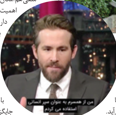
من از همسر به عنوان سپر انسانی استفاده می‌کردم

باتوجه به همه این نکات می‌توانیم بگوییم که هر کدام از ما به عنوان والد وظیفه داریم جدای از احساساتی که به همسرمان داشته داریم، بعد از بچه‌دار شدن، به خاطر عشقی که به فرزندمان داریم، به همسرمان بیشتر از قبل عشق بورزیم. مطمئن باشید با این کار جدای از فوایدی که نصیب فرزندان شما می‌شود، ضایعت شما و همسرتان از زندگی مشترک هم افزایش می‌یابد.