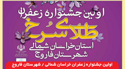
اولین جشنواره زعفران طلای سرخ استان خراسان شمالی / شهرستان فاروج