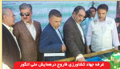
غرفه جهاد کشاورزی فاروج در همایش ملی انگور