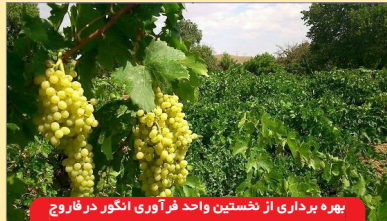
بهره برداری از نخستین واحد فرآوری انگور در فاروج