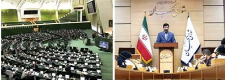
دولت موافق اجرای همسان سازی به شیوه مصوب مجلس نیست

متناسب سازی حقوق بازنشستگان با شاغلان تاکید شده و دولت مکلف بود هر ساله با پیش بینی منابع در بودجه سنواتی، این امر را در دستور کار قرار دهد. حقوق بازنشستگان طبق قانون باید ۹۰ درصد دریافتی شاغلان همتر از آن باشد، اما بازنشستگان در تمامی این سال ها با اجرانشدن قانون بر خلاف آن چه تصور می کردند، حقوق شان متناسب و عادلانه نشده است.