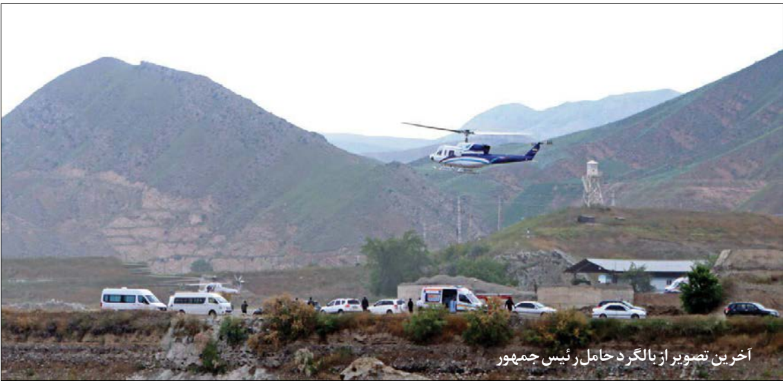
آخرین تصویر از بالگرد حامل رئیس جمهور

رهبر انقلاب تاکید کردند: هیچ اختلالی در کار کشور به وجود نمی آید. مردم نگران نباشند