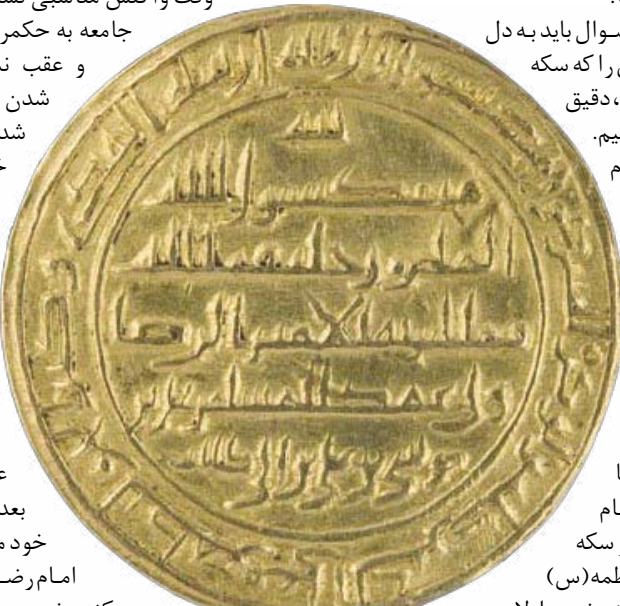
سکه طلای ولايتعهدی، ضرب سمرقند ۲۰۲ هجری قمری

بخشی از اقدامات مامون در این باره بود؛ شیخ صدوق در عیون اخبار الرضا باب جالبی دارد تحت عنوان «باب ذکر ما یقرب به المأمون الی الرضا (ع) من مجادله المخالفین فی الإمامة و التفضیل» یعنی مامون برای این که خود را به امام هشتم (ع) نزدیک کند، برای اثبات امامت با مخالفان امام و برتری اهل بیت (ع) مناظره می‌کند. این نشان می‌دهد که مامون عباسی برای به رسمیت شناختن ارزش‌های جامعه بسته‌سیاستی متنوعی داشته است. در همین سیاست تقرب جویی مامون برای کسب مشروعیت سیاسی است که او به نام امام رضا سکه ضرب می‌کند. رندی و شیطنت مامون در این جا نمایان می‌شود که او؛ امام هشتم (ع) را نه با عنوان «این رسول...» بلکه با عبارت «علی بن موسی بن علی بن ابیطالب» معرفی می‌کند. بر روی سکه ولايتعهدی امام رضا (ع) و در ۷ سطر نوشته شده بود: «الله / محمد رسول الله / المأمون خلیفه الله / مما امر به الامیر الرضا /