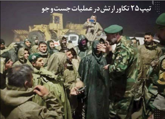
تیپ ۲۵ تکارو ارتش در عملیات جست و جو

در همین راستار هبر معظم انقلاب اسلامی شب گذشته در دیدار جمعی از خانواده های سپاهیان پاسدار به مناسبت شب میلاد امام رضا(ع) گفتند: «اشاره ای می کنم به حادثه نگران کننده ای که برای رئیس جمهور محترم و همراهان شان پیش آمد. امیدواریم خداوند متعال به سلامتی کامل، رئیس جمهور عزیز ما و همراهان شان را به آغوش ملت برگرداند. البته دعا باید بکنیم، شما هم دعا کنید، همه دعا کنند، سلامت این جمع خدمتگزار را، که در رأسشان رئیس جمهور محترم و معتنم قرار دارد. خدمتگزاری آن ها و تلاش شان برای کشور، نعمت بزرگی است امیدواریم خدای متعال این نعمت را از کشور سلب نکند. و لکن مردم عزیزمان – چه شما که اینجا نشستید، چه کسانی که بعداعرایض ما را می شنوند – مطمئن