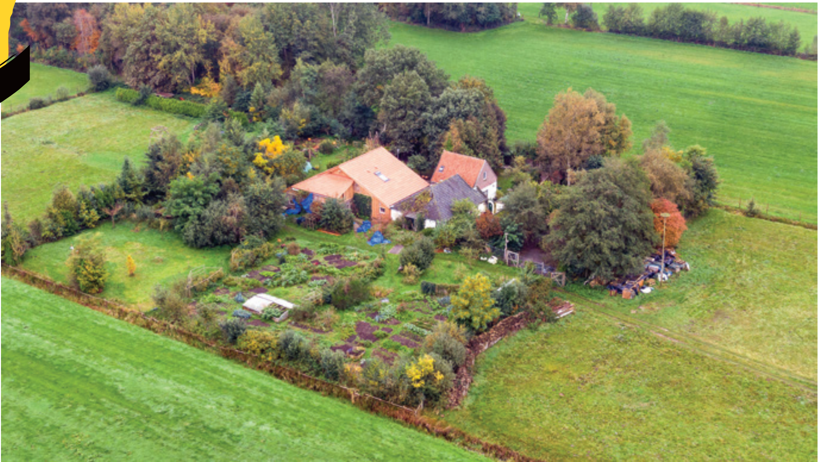
عکس از محل زندگی خانواده هلندی که به تازگی کشف شده‌اند

آشنایی با افرادی که سال‌ها دور از چشم دیگران در کوه، جنگل و ... زندگی کرده‌اند؛ به بهانه کشف خانواده‌ای در هلند که ۹ سال هیچ فردی آن‌ها را ندیده بود