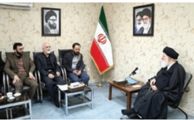
نماینده ولی فقیه در استان در دیدار با مدیر شبکه قرآن: