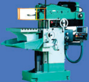
ماشین سازی تبریز