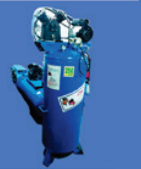
صنعت باد تهران