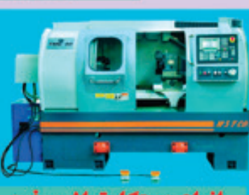
انواع دستگاه تراش و فرز