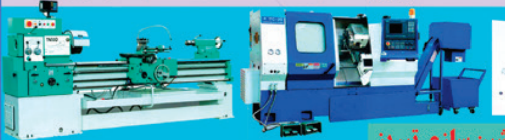
ماشین سازی تبریز