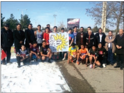
گروهی از ورزشکاران و مسئولان در مراسم افتتاحیه مسابقات.