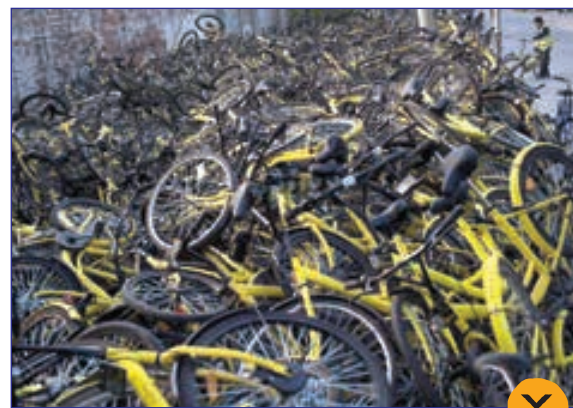
یک مرکز اجاره دوچرخه در چین