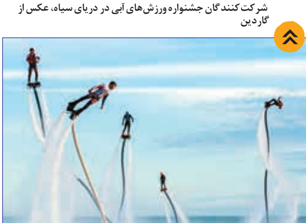
شرکت کنندگان جشنواره ورزش‌های آبی در دریای سیاه