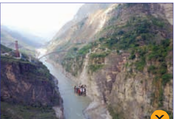
ساکنان محلی سوار بر یک تله کابین برای عزیمت به سمت شهر