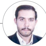
رئیس اداره تعاونی ها