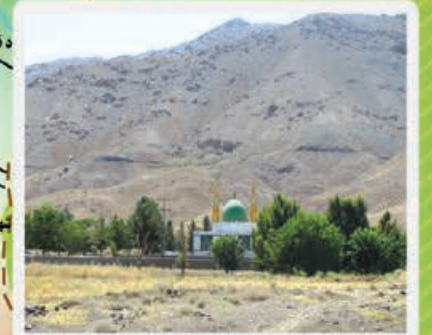
امامزاده روستای گت