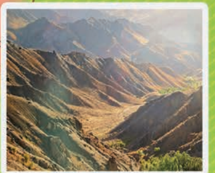
طبیعت روستای فریمانه