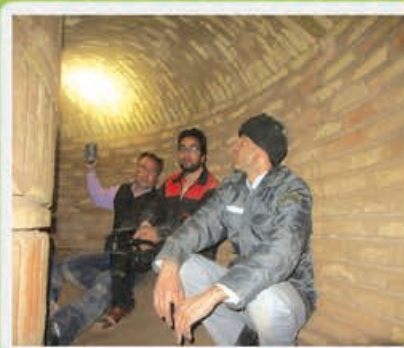
قلعه زیرزمینی آزادوار