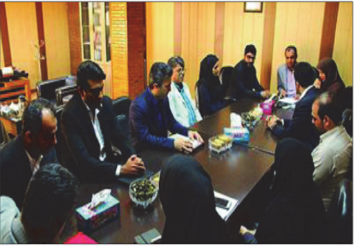
انجام خواهد داد. این مقام مسئول از ادغام سازمان کشتارگاه و سازمان میادین میوه و تره و خیار خبر داد و بیان کرد: سازمانی تحت عنوان مشاغل شهری و فرآورده های کشاورزی فعالیت های این دو سازمان را انجام خواهد داد.

سفرای خارجی را برقراری روابط اقتصادی بین بازرگانان و تجار دو طرف عنوان کرد و گفت: رایزنان بازرگانی سفارت تایلند می توانند با شناسایی بازرگانان و تولیدات دو کشور، زمینه آشنایی و همکاری فعالان اقتصادی دو طرف را فراهم کنند. کالاینا ویپاتی بومی پراتس (Kallayana vipatipumiprates)، سفیر تایلند در ایران نیز در این دیدار از آمادگی سفارت تایلند برای برقراری روابط تجاری بین اصفهان و تایلند خبر داد و گفت: آشنایی بازرگانان با ظرفیت های موجود می تواند سطح همکاری های اقتصادی دو طرف را افزایش دهد . وی به تمحیل چند دانشجوی تایلندی در دانشگاه اصفهان اشاره کرد و گفت: اصفهان به عنوان یکی از شهرهای مهم و تأثیرگذار ایران شناخته می شود و تایلند خواستار توسعه همکاری اقتصادی و فرهنگی با این شهر است. وی حضور پیروان ادیان الهی در اصفهان را نمونه موفق همزیستی مسالمت آمیز ادیان برشمرد و گفت: فعالیت کلیساها، کنیسه ها، لواتشکده های زرتشتی در کنار مساجد نمونه ای کم نظیر در سطح جهان است .