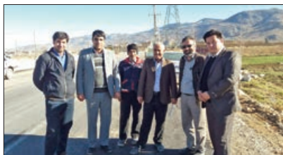
بازدید شهردار و اعضای محترم شورای اسلامی از عملیات زیر سازی بلوار کشاورز

در گفت و گو با رئیس شبکه دامپزشکی مانه و سملقان تشریح شد: