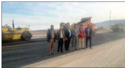
بازدید اعضای شورای اسلامی به همراه شهردار از عملیات آسفالت در بلوار کشاورز