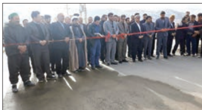
افتتاح پروژه بلوار کشاورز