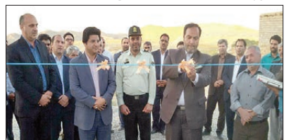
افتتاح مخزن آب روستای لائین نوبا با اعتبار ۲ میلیارد و ۳۰۰ میلیون تومان