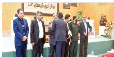
تقدیر از کارمندان نمونه ادارات شهرستان