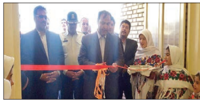
افتتاح پروژه مدرسه روستای چرم کهنه با اعتبار ۴۸۰ م