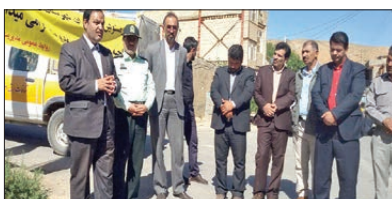
افتتاح ۲ دستگاه پست توزیع برق با اعتبار ۱۰۰ میلیون تومان

دو عامل مهم و یک عامل نیمه مهم باعث عدم توسعه شهرستان است. وجود گوناگونی اقوام مختلف در یک شهرستان مانند کلات باعث شده است منطقه دارای انسجام اجتماعی خاصی نباشد و عدم انسجام تا به امروز در توسعه منطقه خیلی تاثیر گذار بوده و در مدتی که من اینجا بوده ام سعی کردم با برگزاری همایش ها و سرد کردن بعضی از تعاملات خشن که بین بعضی از گروه ها بود این عدم انسجام مدیریت شود و بیکپار چگی به وجود آید که البته آیندگان نیز