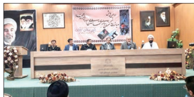
برگزاری همایش صیانت و گفتمان سازی مبارزه با مواد مخدر کلات