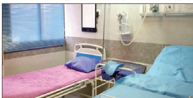
افتتاح بلوک زایمان بیمارستان کلات با اعتبار ۱۸۰ م