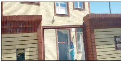
افتتاح پروژه منزل مسکونی مددجوی بهزیستی با اعتبار ۷۰ م