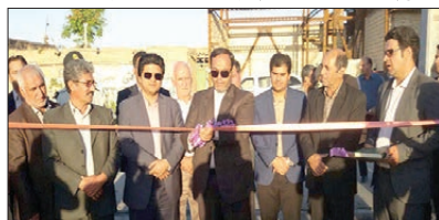
افتتاح پروژه آسفالت روستای لائین نوبا با اعتبار ۹۰۰ م