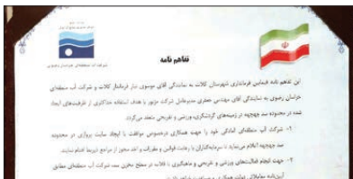
امضای تفاهم نامه بین مدیر عامل آب منطقه ای استان و فرماندار کلات