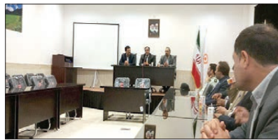
افتتاح پروژه سالن اجتماعات ادار بهزیستی با اعتبار ۷۰ م