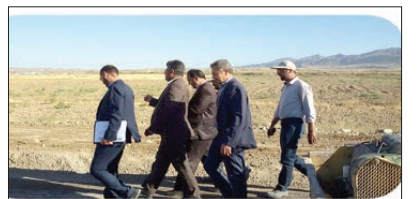
افتتاح پروژه آسفالت روستای قریه تیکان و قلیچ آباد با اعتبار ۳۶۵ م