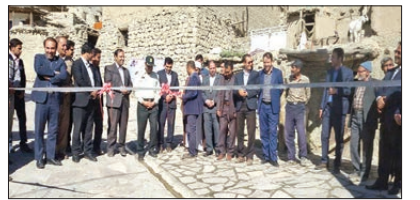
افتتاح پروژه سنگ فرش روستای توریستی حمام قلعه با اعتبار ۶۰ م