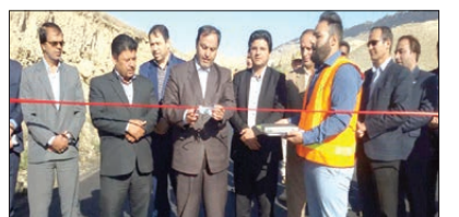
افتتاح پروژه آسفالت محور کلات به مشهد با اعتبار ۲ میلیارد تومان