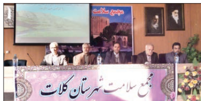
برگزاری مجمع سلامت شهرستان