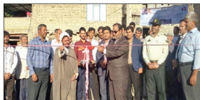
افتتاح پروژه آسفالت روستای قبا با اعتبار ۲۰۰ م