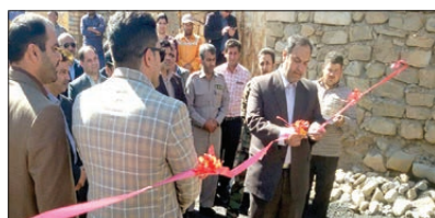
افتتاح پروژه آسفالت در بند و نقاط دیگر با اعتبار ۲۵۰ م