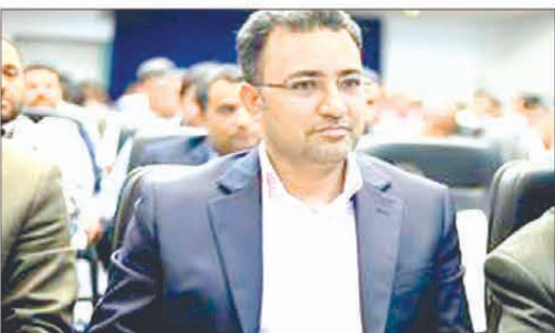
مدیران شهری توسط شهردار بندرعباس، شهر را به سمت پویایی بیشتر خواهند رساند.

از خانواده در سنگر خدمت به شهروندان و هموطنان قرار گرفته اند. رئیس شورای اسلامی شهر بندرعباس با اشاره به اقدامات انجام شده در ایام تعطیلات نوروز توسط شهرداری بندرعباس، تأکید کرد: توقعی که از شهرداری داریم این است که خدماتی که در ایام عید به شهروندان و گردشگران ارائه شد، در طول سال هم به شهروندان این شهر ارائه شود. وی در ادامه گفت: همه ما به عنوان خادمین و خدمتگزاران این شهروندان هستیم و باید شهر را به سمتی پیش ببریم که در محور شأن و جایگاه شهروندان بندرعباسی باشد. باوقار با بیان اینکه شهردار بندرعباس در دوره قبل، کارنامه قابل قبولی داشتند، افزود: انتخاب خوب