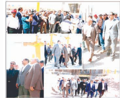
رئیس شورای اسلامی شهر بندرعباس: