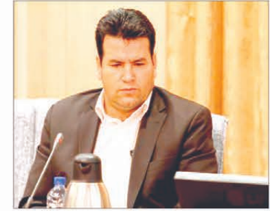
تبریز - فلاح: عضو شورای اسلامی شهر تبریز استقبال نوروزی از تبریز را چشمگیر عنوان کرد.

کرد و گفت: نوروز امسال شاهد استقبال گردشگران داخلی و خارجی از تبریز بودیم اما متأسفانه میانگین اقامت در شهر ما کم است و با برنامه ای بلند مدت باید سعی کنیم میانگین اقامت را افزایش دهیم.