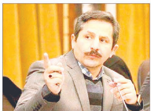
تبریز - : شهردار تبریز با تأکید بر خطر وقوع زلزله در تبریز از احداث ۳۰ واحد فضای امن در مناطق حاشیه نشین