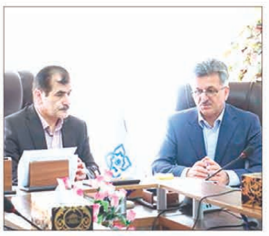
مدیرکل راه و شهرسازی آذربایجان غربی: