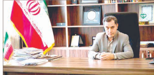
تبریز - فلاح: شهردار منطقه ۹ کلانشهر تبریز گفت: شهر تبریز، فیروزه جهان اسلام، شهر اولین ها، شهر سردار و سالار ملی، شهر باکری