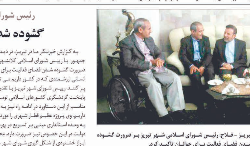
تبریز - فلاح: رئیس شورای اسلامی شهر تبریز بر ضرورت گشوده شدن فضای فعالیت برای جوانان تأکید کرد.

صورت اهداف مورد نظر محقق نخواهد شد. وی با اشاره به توصیه های صورت گرفته در خصوص مصرف صحیح آب و برق گفت: برخی از دستگاهها که به مردم تذکر می دهند خودشان دچار اسراف هستند که این گونه مسائل با توجه به امکانات روز از چشم مردم دور نیست. امام جمعه قم و تولیت استان مقدس حضرت فاطمه معصومه (س) تصریح کرد: دستگاههای دولتی شعارهایی را که در مورد صرفه جویی می دهند را باید با عمل خود نشان دهند تا تأثیرگذاری لازم را بر روی مردم داشته باشد. وی با تأکید بر اینکه باید از تمام امکاناتی که در اختیار است به نحو مطلوب استفاده شود،