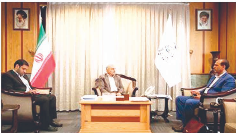
جمع آوری و خطوط انتقال فاضلاب داشته ایپیمی افزود: به هزینه کرد حدود ۱۵ میلیارد ریالی توانستیم رنگ غربی و شرقی آب قم را که حدود ۲۰۰۰ میلیارد ریال برای آن هزینه شده بود به بهره برداری برسانیم.

قم- استاندار قم در دیدار مدیر کل آبفای قم گفت: بهره وری در منابع آب نیازمند عزم عمومی است.