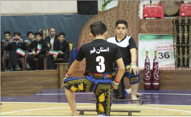
رئیسان فدراسیون های ورزشی در این مراسم اشاره کردند و خطاب به دانش آموزان گفت: آمده اند تا استعدادها فراهم شده است. وی به حضور چند تن از

استعدادهای را غربال و در بدنه تیم های ملی از شما استفاده کنند. وی با بیان این که امروز شماره های ورزش دانش آموزی در این مسابقه ها شرکت کرده اند، گفت: مصمم هستم که در کنار ورزش دانش آموزی، در سطح گسترده، ورزش ۹۵۰ هزار معلم زحمتکش و سختکوش وزارت آموزش و پرورش را طراحی، برنامه ریزی و در سطح وسیع اجرا کنیم. حمیدی در بخش دیگر سخنان خود گفت: خوشحال هستم که این دوره از مسابقات ورزشی دانش آموزی در شهر مقدس قم، برگزار شود. همچنین در کنار بارگاه ملکوتی حضرت فاطمه معصومه(س) و همزمان با آغاز دهه مبارک فجر به مناسبت چهلمین سالگرد پیروزی شکوهمند انقلاب اسلامی ایران برگزار می شود. سی و ششمین دوره مسابقات ورزشی دانش آموزان پسر کشور به میزبانی قم با حضور ۲ هزار دانش آموز ورزشکار، مربیان، سرپرستان و داوران تا سیزدهم بهمن ماه جاری در چهار رشته ورزشی (کشتی پهلوانی و زورخانه ای، بسکتبال سه نفره، لنگ و کبک) در پنج سالن ورزشی شهر قم ترتیب می یابد.