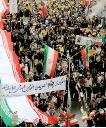
راهپیمایی یوم الله ۲۲ بهمن

دکتر شریعتمداری با اشاره به مشکلات ذوب آهن در تأمین مواد اولیه، گفت: این مجتمع عظیم صنعتی، در راه اندازی معادن کشور نقش مهمی ایفا نموده و هم اکنون هم آرم آن در بسیاری از معادن می‌درخشد اما امروز با مشکلاتی مواجه است که برای حل آن باید اقدامات لازم در حوزه مدیریت و مالکیت معادن انجام شود. دکتر عباس رضایی استاندار اصفهان نیز در این نشست، تلاشگران ذوب آهن اصفهان را، سرمایه‌ای ارزشمند برای نظام جمهوری اسلامی دانست و گفت: یکی از پروژه‌های مهمی که می‌توان با ذوب آهن اصفهان و به انجام رساند و ارزش بسیاری نیز