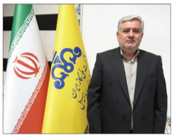
مجلس شورای اسلامی