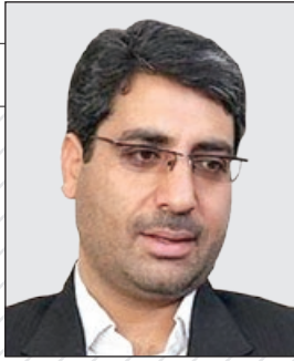
معاون استاندار: یک شهرک جدید در شرق مشهد ایجاد می شود