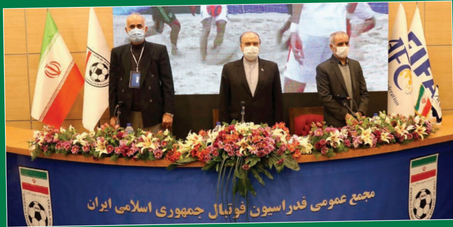
مجمع عمومی فدراسیون فوتبال جمهوری اسلامی ایران

تصویب اساسنامه فدراسیون فوتبال با ۷۰ رای در جلسه آنلاین تصویب شد