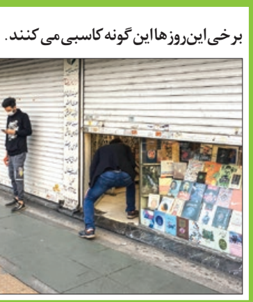
برخی این روزها این گونه کاسبی می کنند.