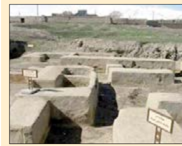
چهل و ششمین نشست خود را از ۲۱ تا ۲۴ جولای (۳۱ تیر تا ۴ مرداد ۱۴۰۳) در دهلی نو (هند) برگزار می کند.