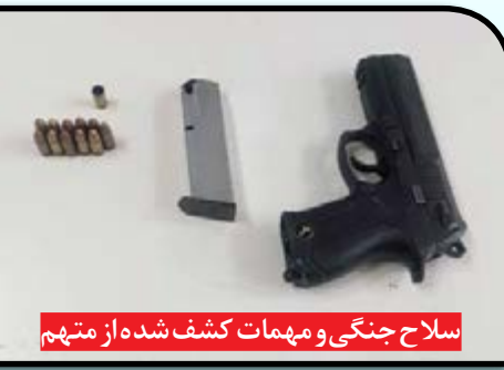
سلاح جنگی و مهمات کشف شده از متهم

برده است. سر تپ دوم نگهبان خاطر نشان کرد: در این شرایط نیروهای پلیس امنیت عمومی با هماهنگی قضایی و در یک عملیات ضربتی با رعایت موارد امنیتی، مخفیگاه وی را محاصره کردند و او را قبل از آن که بتواند از سلاح خود استفاده کند به دام انداختند که بررسی های بیشتر در این باره آغاز شده است.