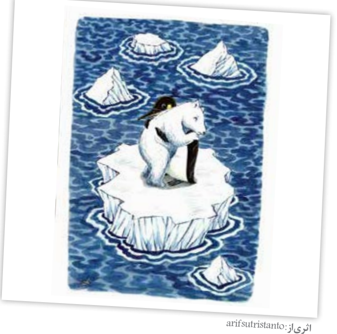
اثری از: arifstristanto

بید که برای اتفاق و دستاوردی، بد. چه احساسات دیگری در آن