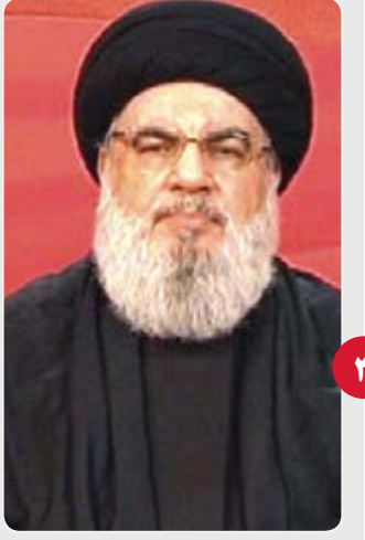
«تهدید ترسناک» نصرا... جنوب لبنان گورستان تانک‌های رژیم صهیونیستی خواهد شد