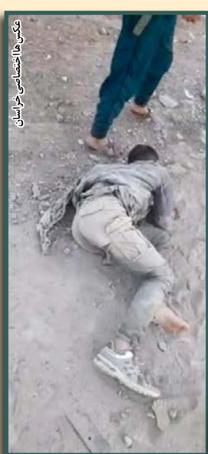
تصاویری از صحنه‌های شرارت باند

چنان جو ترسناکی به راه انداخته‌اند که هیچ‌کس جرئت شکایت از آنان را ندارد به طوری که آنان هنگام ایجاد مزاحمت برای یکی از بانوان، مرد کشاورزی را نیز با چاقو مجروح کرده‌اند که قصد جلوگیری از اقدامات مجرمانه آنان را داشت و حتی دامنه نزاع‌های هولناک را به مقابل پزشکی قانونی مشهد نیز کشانده‌اند. این‌گونه بود که اعضای این باند خطرناک زیر چتر اطلاعاتی پلیس قرار گرفتند و ۵ عضو این گروه در عملیات ضربتی در بولوار توس مشهد به دام افتادند. طبق اطلاعات خبرنگار روزنامه خراسان، این متهمان با دستور العمل‌های دادستان مرکز خراسان رضوی برای انجام تحقیقات به مقر پلیس اطلاعات و امنیت عمومی مشهد انتقال یافتند.