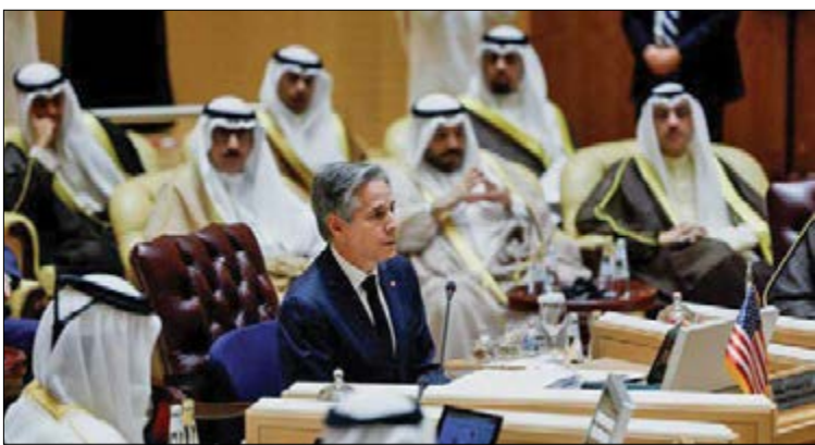
وزیر خارجه آمریکا خواستار سیستم دفاعی یکپارچه کشورهای عرب حاشیه خلیج فارس در مقابل ایران شد