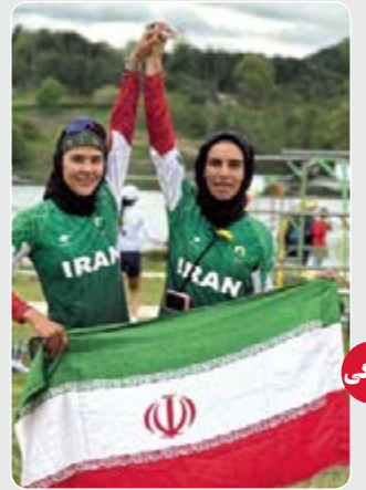
زندگی منتظر تاریخ سازی بعدی ما باشید کسب اولین سهمیه المپیک قایق دونفره در تاریخ قایقرانی ایران

چند روزی است که بحث تغییر نام استقلال به «استقلال خلیج فارس» مطرح و در کنار تایید و تکذیب های مسئولان، با واکنش های عمدتاً منفی مواجه شده است. صفحه ۴