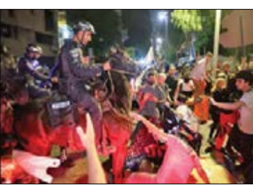
تظاهرات علیه نتانیاهو در شهر تل آویو اسرائیل