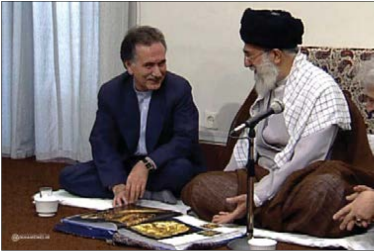
دیدار کیومرث صابری فومنی با محمد حسن یادگاری

به مناسبت ۱۱ اردیبهشت، سالروز درگذشت زنده یاد کیومرث صابری فومنی، افزون بر بازخوانی جریان سازی های کم نظیر او، با محمد حسن یادگاری، سازنده مستند «روزگار گل آقایی» هم سخن شدیم