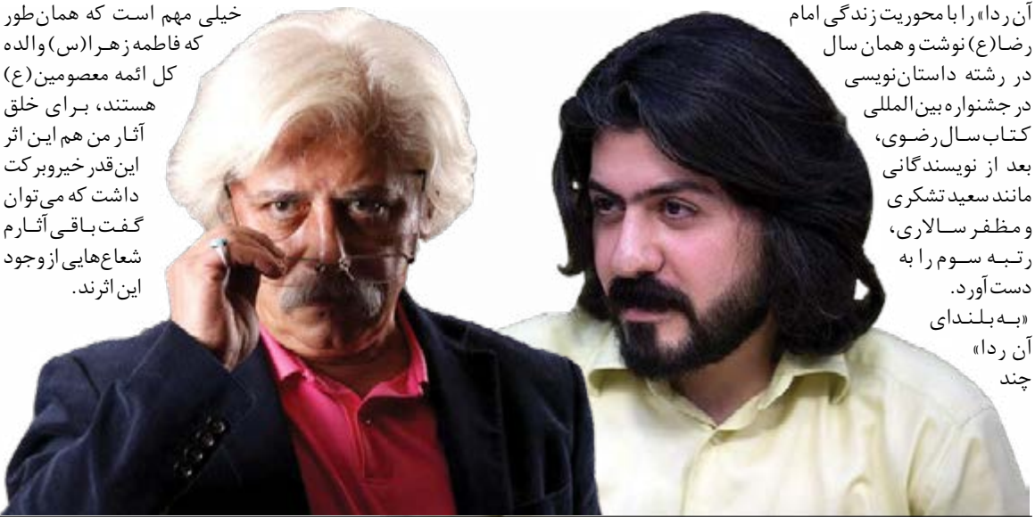
خیلی مهم است که همان‌طور که فاطمه زهرا (س) و والده کل‌ائمه معصومین (ع) هستند، برای خلق آثار من هم این اثر این قدر خیر و برکت داشت که می‌توان گفت باقی آثارم شعاع‌هایی از وجود این اثرند.

سید مهدی شجاعی ۶۴ ساله به پدر ادبیات آینی ایران معروف است؛ دل‌پیش هم چیره دستی او در خلق آثار داستانی و ترجمه‌های دلنشین ادبی از زندگی ائمه اطهار (ع) و زیارت‌نامه‌ها و دعا‌های آن‌هاست. کتاب‌های سید مهدی شجاعی نیازی به معرفی ندارند و هر کدام به دلیل استقبال مخاطب، مدام در حال تجدید چاپ هستند. یکی از مشهورترین آثار این نویسنده «کشتی پهلو گرفته» با محوریت زندگی حضرت فاطمه (س) است. این کتاب که برای اولین بار در سال ۱۳۶۸ منتشر شد، حالا چاپ ششم‌را پشت سر گذاشته است. سید مهدی شجاعی در باره این کتاب گفته است: «منشأ از نوشتن چند کتاب، به تجربه لازم در نوشتن «به بلندی آن‌ردا» رسیده است. توصیف‌های دقیق و جزئی‌نگری نویسنده، فضای داستان را برای مخاطب به شدت عینی کرده است.