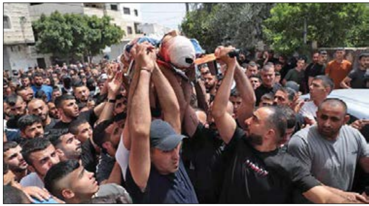
همزمان با عزای عمومی و اعتصاب سراسری در جنین در پی شهادت یکی از فرماندهان جهاد اسلامی، حماس ۱۵ نظامی اسرائیلی را در شرق رفح از پا درآورد