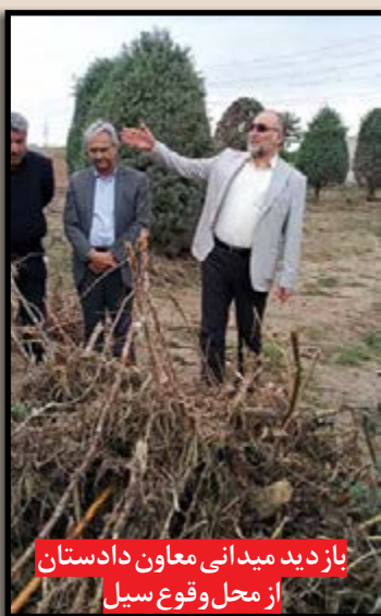
بازدید میدانی معاون دادستان از محل وقوع سیل