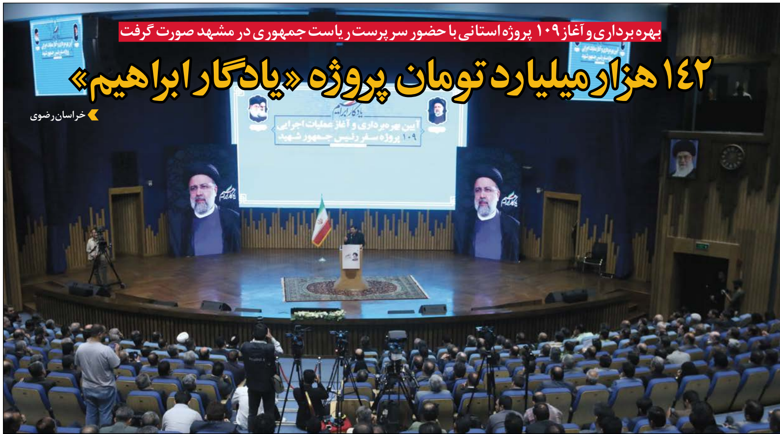
بهره‌برداری و آغاز ۱۰۹ پروژه استانی با حضور سرپرست ریاست جمهوری در مشهد صورت گرفت