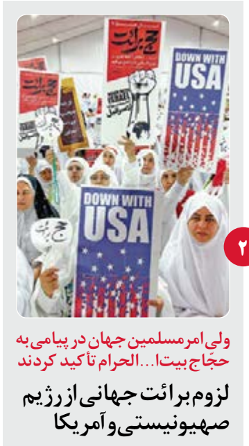
ولی امر مسلمین جهان در پیامی به حجاج بیتا... الحرام تاکید کردند لزوم برائت جهانی از رژیم صهیونیستی و آمریکا

۲۰ صفحه ۱۲ صفحه سراسری + ۸ صفحه زندگی سالم ۴۰ صفحه روزنامه آسانی ۴۰ چاپ همزمان در مشهد و تهران