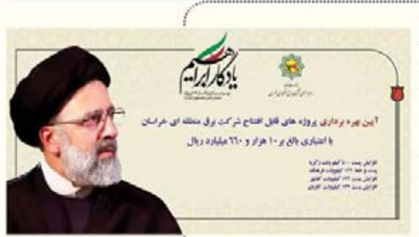
آیین بهره برداری پروژه های نقل افتتاح شرکت برق منطقه ای خراسان با حضور وزیر نیرو و وزیر نیرو و وزیر نیرو و وزیر نیرو

به گزارش روابط عمومی شرکت برق منطقه ای خراسان، پروژه های افزایش ظرفیت پست ۴۰۰ کیلوولت زکریا به ۶۳۰ مگاوات امیر، احداث پست ۱۳۲ کیلوولت GIS فرهنگ به ظرفیت ۱۰۰ مگاوات امیر، افزایش ظرفیت پست ۱۳۲ کیلوولت گلشهر به ۷۰ مگاوات امیر و افزایش ظرفیت پست ۱۳۲ کیلوولت کابویان به ۶۰ مگاوات امیر با حضور سرپرست ریاست جمهوری و وزیر نیرو و وزیر نیرو و وزیر نیرو و وزیر نیرو در این مراسم که با عنوان طرح یادگار ابراهیم به طور متمرکز پروژه های صنعت آب و برق استان خراسان رضوی افتتاح شد وزیر نیرو گفت: رئیس جمهور شهید برای تأمین آب و برق مردم خدمات ارزنده ای انجام داد از جمله، این پروژه هایی است که با همت شرکت برق منطقه ای خراسان در کمترین زمان ممکن و با تجهیزات ساخت داخل انجام شده است.