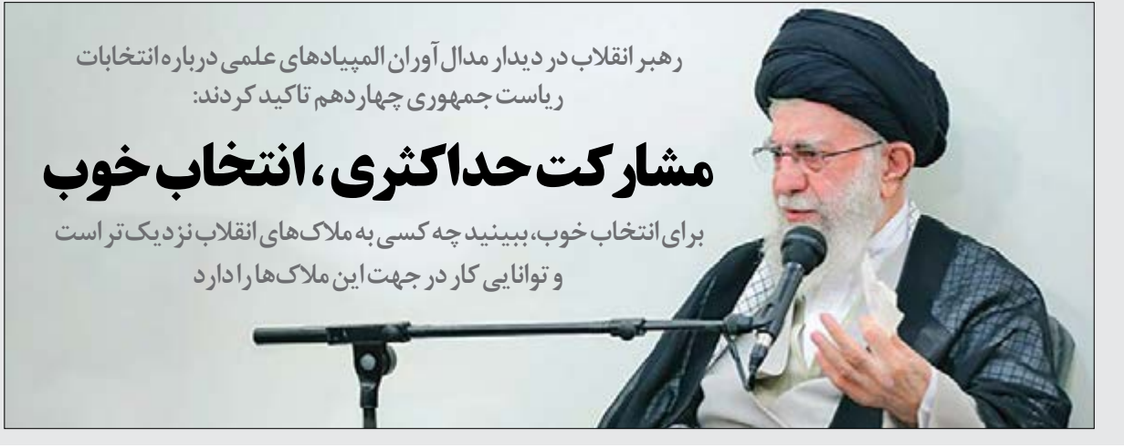
رهبر انقلاب در دیدار مدل‌آوران المپیادهای علمی درباره انتخابات ریاست جمهوری چهاردهم تأکید کردند: مشارکت حداکثری، انتخاب خوب برای انتخاب خوب، ببینید چه کسی به ملاک‌های انقلاب نزدیک‌تر است و توانایی کار در جهت این ملاک‌ها را دارد

گروه سیاسی - رهبر معظم انقلاب اسلامی ظهر دیروز در بخشی از دیدار صمیمانه با جمعی از جوانان مدل‌آور در المپیادهای دانش‌آموزی و دانشجویی داخلی و جهانی، استقلال سیاسی کشور را واقعیتی محسوس خواندند و گفتند: جمهوری اسلامی درباره مسائل مهم جهان، جایگاه، منطق و حرف‌های شنیدنی دارد که حتی مخالفان ما روی آن حساب می‌کنند. ایشان تأکید کردند: این استقلال سیاسی نباید خدشه‌دار شود و هر دولتی سر کار می‌آید باید آن را حفظ کند. حضرت آیت‌الله... خامنه‌ای همچنین در پاسخ به سوال یکی از نخبگان جوان درباره انتخابات گفتند: در انتخابات بسیار مهم پیش‌رو، در درجه اول افزایش مشارکت مهم است؛ بنابراین لازم است در محیط‌های کاری دانشجویی و خانوادگی، در این زمینه هر چه ممکن است تلاش کرد. رهبر انقلاب در تبیین معیارهای انتخاب نیز گفتند: برای انتخاب خوب، ببینید چه کسی به ملاک‌های انقلاب نزدیک‌تر است و توانایی کار در جهت این ملاک‌ها را دارد.