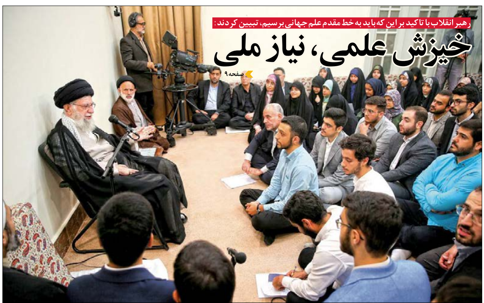
رهبان انقلاب با تاکید بر این که باید به خط مقدم علم جهانی برسیم، تبیین کردند: