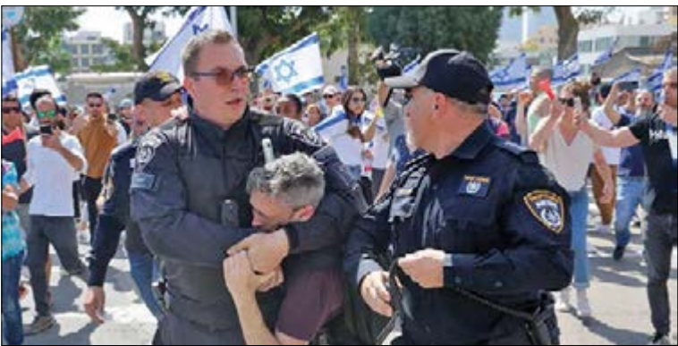
شهرک نشینان اسرائیلی در تظاهراتی گسترده، کابینه نتانیاها را کابینه ویرانی و تخریب توصیف کردند و کناره‌گیری او را خواستار شدند