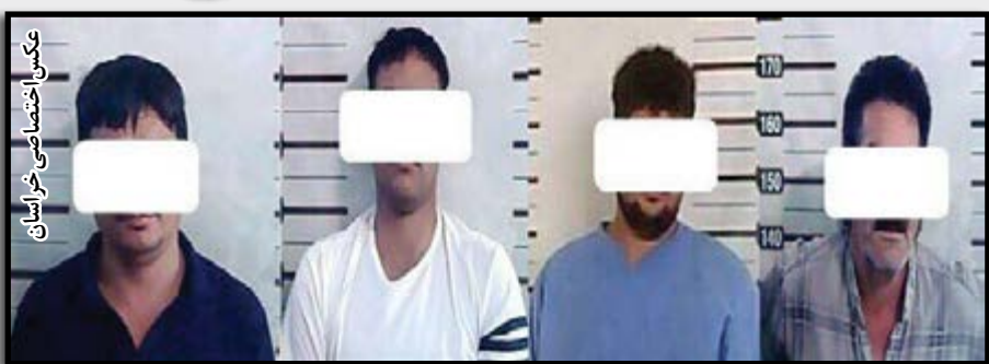
عکس اختصاصی خبرنگار خراسان

تمرکز پلیس در محیط جغرافیایی جرم نیز نتیجه ای نداشت چرا که سرقت مذکور در همه نقاط شهر رخ داده بود به همین خاطر تحلیل های کارشناسی بر پیگیری علمی و بهره گیری از شیوه های نوین پلیسی متمرکز شد و کارآگاهان با بازبینی دوربین های ترافیکی بالاخره سارق جوانی را ردیابی کردند که در یکی از روستاهای اطراف جاده کلات سکونت داشت. فر مانده حافظان امنیت تصریح کرد: کارآگاهان اداره مبارزه با سرقت در یک عملیات ضربتی و با اشراف اطلاعاتی موفق شدند این سارق جوان را در یکی از خانه های روستایی و با هماهنگی قضایی دستگیر و به مقر انتظامی هدایت کنند. سرگرد نگهبان با اشاره به اعترافات و سوابق ای دزد بی رحم تاکید کرد: این سارق جوان که ۳ بار سابقه زندان به جرم سرقت خودرو را دارد در بازجویی ها به سرقت ۵۰ دستگاه پراید مدل پایین در کمتر از ۹ ماه اعتراف کرد و ۳ مالخر خودرو را نیز لو داد که در همان روستا زندگی می کردند.