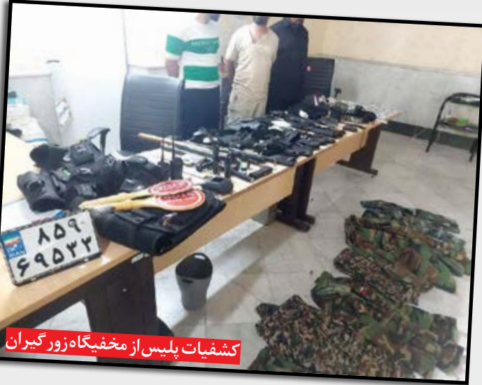
کشفیات پلیس از مخفیگاه زورگیران

موتور سیکلت سرقتی در بزرگراه شهید با نظر شناسایی شد و گروهی از افسران عملیاتی به سرپرستی سرهنگ تاج بخش (رئیس اداره مبارزه با جرایم خشن) به تعقیب موتور سیکلت بنلی پرداختند؛ اما راکب ۳۷ ساله که متوجه پلیس شده بود، به سوی پمپ گاز ریخت و تلاش کرد از چنگ نیروهای انتظامی فرار کند اما کارآگاهان بی درنگ مسیرهای فرار را بستند و او را زمین گیر کردند. با انتقال این متهم به مقر انتظامی مشخص شد که او مالخر باند مخوف ماموران قلابی است که