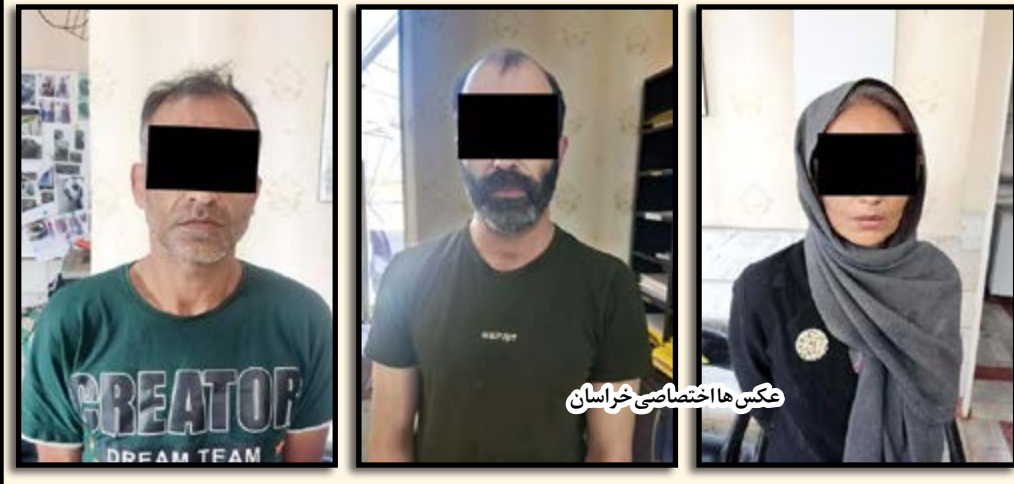
عکس ها اختصاصی خراسان

از مرزهای شرقی وارد کشور شده است. فرمانده انتظامی استان کرمان در ادامه با اشاره به کاهش ۱۲ درصدی وقوع سرقت ها و اقدامات مثبت مجموعه انتظامی در سایر حوزه ها، کاهش جرایم را مرهون رویکردهای آگاه سازی اصحاب رسانه دانست. وی خاطر نشان کرد: در موضوع سرقت نیز بنا به تدابیر فرمانده کل انتظامی و با هماهنگی مراجع قضایی، به افرادی که دارای سابقه سه سرقت به بالا هستند، با بندهای الکترونیکی نصب می‌شود که در این خصوص نیز انهدام چندین باند سرقت و همچنین باند جعل اینترنتی غیر مجاز است.